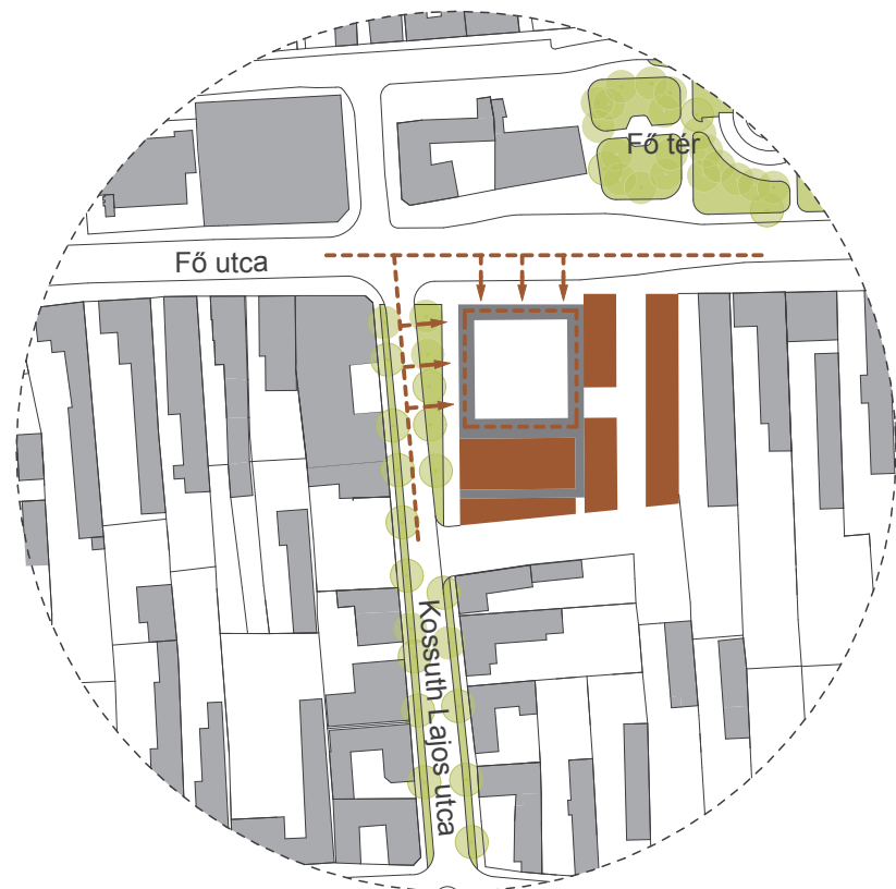
ÜTEM 01 HELYSZÍNRAJZ M 1:2000