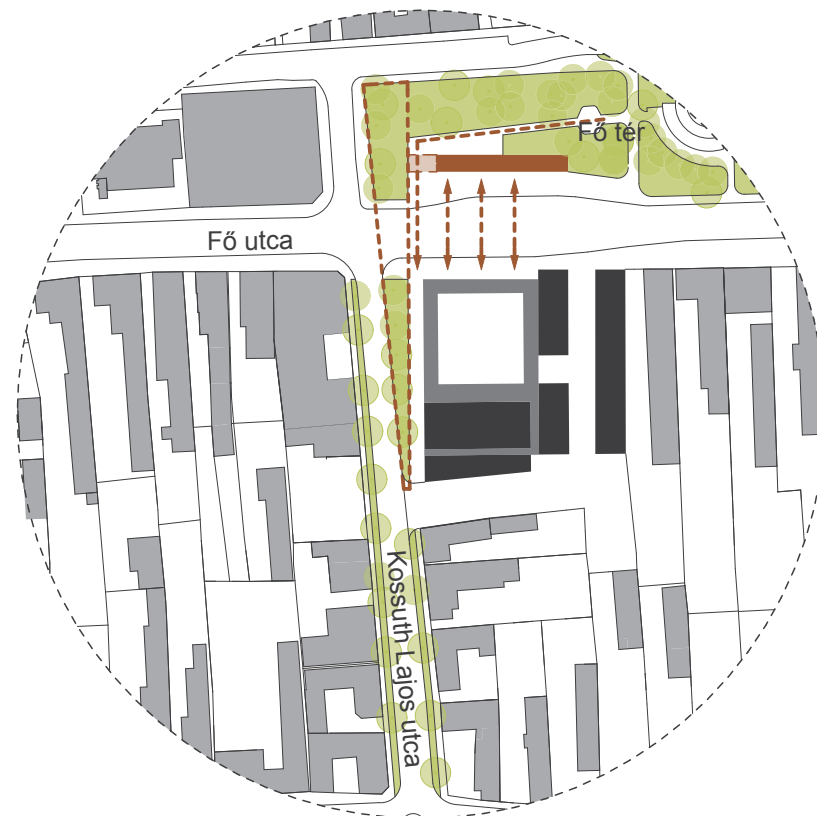
ÜTEM 02 HELYSZÍNRAJZ M 1:2000